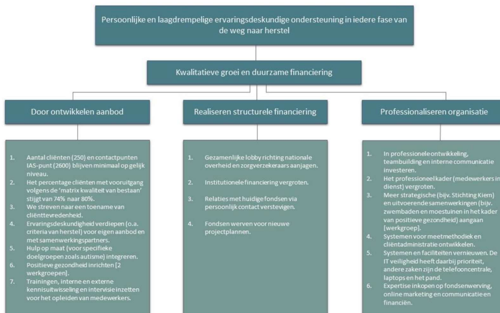
Figuur 2. Strategische speerpunten

Wegens de groeiende vraag, het feit dat steeds meer cliënten en partners de weg naar Stichting JIJ weten te vinden én de financiële steun die de stichting in 2022 van fondsen, gemeenten en donateurs mocht ontvangen en reeds toegekend heeft gekregen voor 2023, verwacht de stichting, ook de komende jaren haar (kern)activiteiten te blijven uitvoeren. Daarnaast hoopt zij extra budget te verkrijgen voor versterking/uitbreiding van het team van professionals en doorontwikkeling. In figuur 2 zijn de strategische speerpunten beschreven.